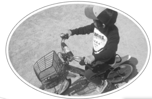
コマなし自転車に 乗れるようになったよ!