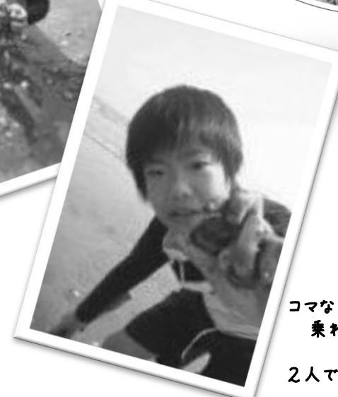
2人でデコってみました☆