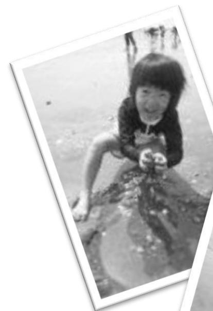
家族4人で 潮干狩りにいったよ! いっぱい貝がとれた~!