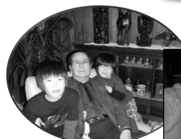
親戚のおじいちゃんとお兄ちゃんとお姉ちゃんと!