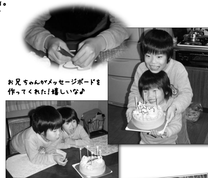
お兄ちゃんがメッセージボードを作ってくれた!嬉しいな♪