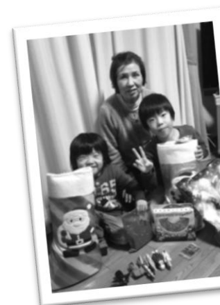
じいちゃん&おばちゃんとパーティ。プレゼントいっぱいもらったよ★