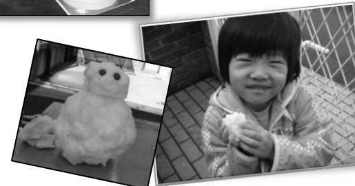
雪だるまちゃん可愛いでしょ?