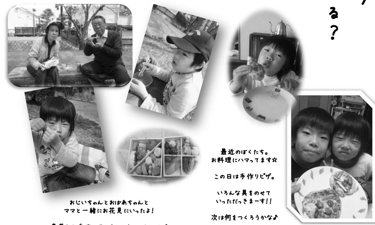
おじいちゃんとおばあちゃんと ママと一緒に花見にいったよ!

最近のぼくたち。 お料理にハマってます☆ この日は手作りピザ。 いろんな具をのせて いったっきまーす!! 次は何をつくらうかな♪