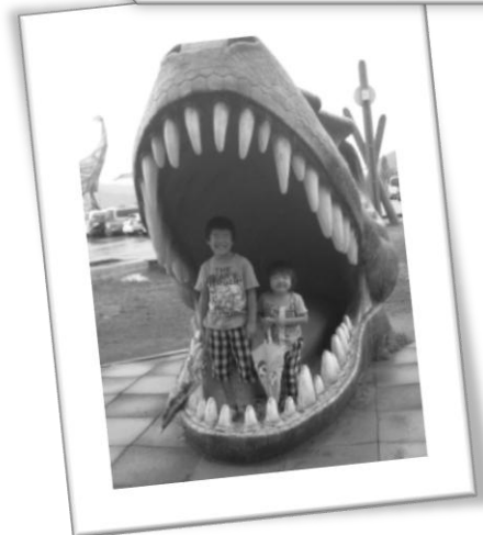
恐竜博物館おもしろかったね。 2人で食べられちゃった！