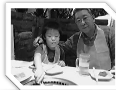
おじいちゃん お誕生日おめでとう。 今日はボクがお世話係です！