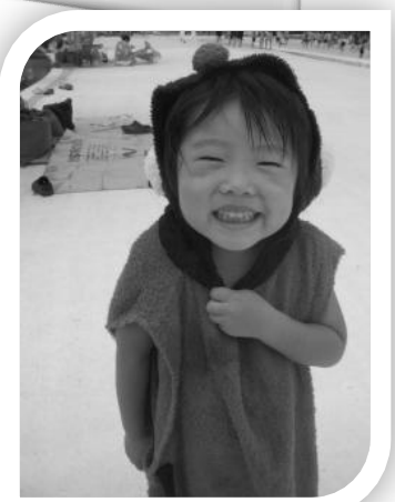
ボク、てんとう虫ちゃんです。 お水遊びだーいすきだもん！