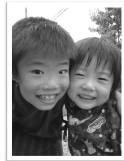
今から夏祭りにいくよ。 いっぱい遊ぶぞ～！！