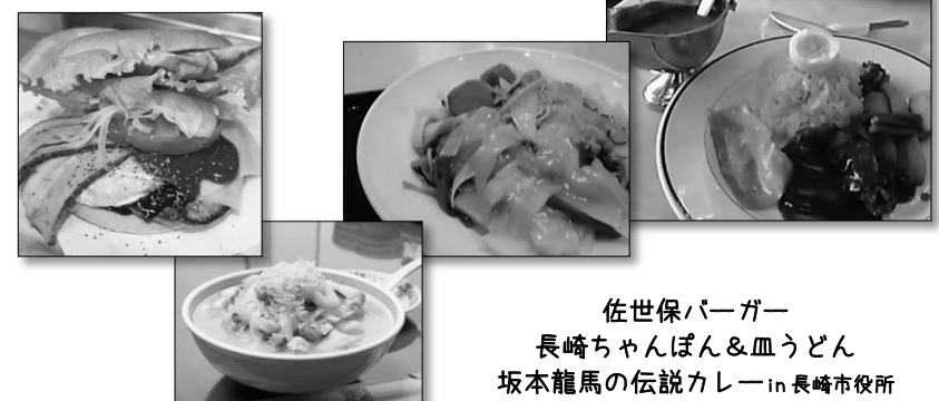
佐世保バーガー 長崎ちゃんぽん&血うどん 坂本龍馬の伝説カレー in 長崎市役所