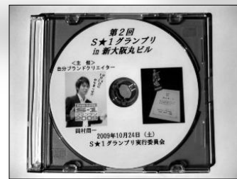
なんと!DVD化が決定!! アマプロにて好評発売中です♪