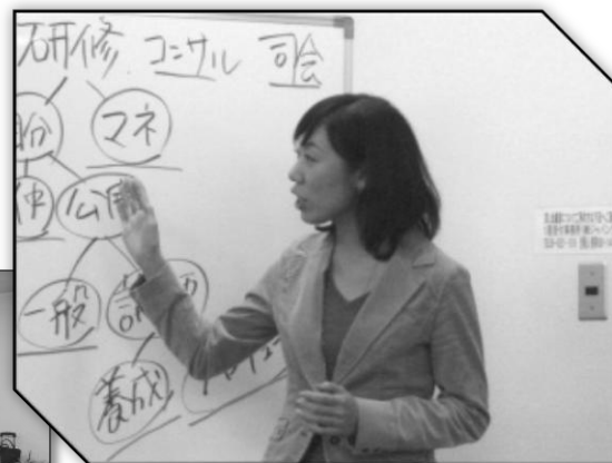
“キラキラ整理整頓術”で ねーやんが3位入賞しました☆