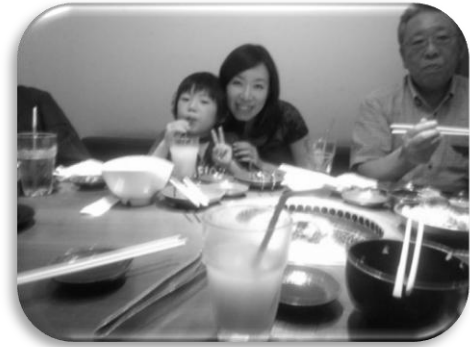
家族そろっての父の日パーティ。パパさんリクエストの焼き肉でした！