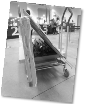
事務所の移転準備にてんてこ舞い。