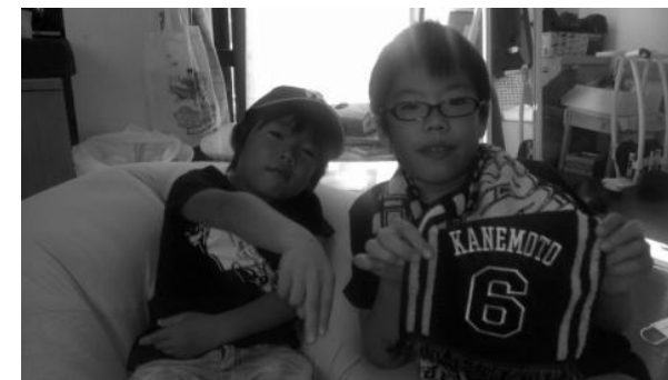
いまは毎日運動会の練習で大忙しだよ。 2人とも気合十分、衣装もバッチリ決まっています♪