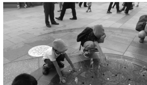
いっぱい遊んだ夏休みが終わって学校スタート!